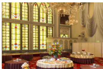
【ヴェネチアホール/5F】