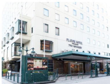
PLATON HOTEL YOKKAICHI