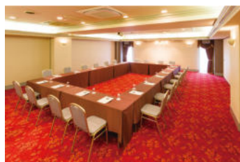
【エメラルドホール/3F】